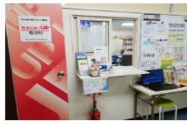
事務所カウンター